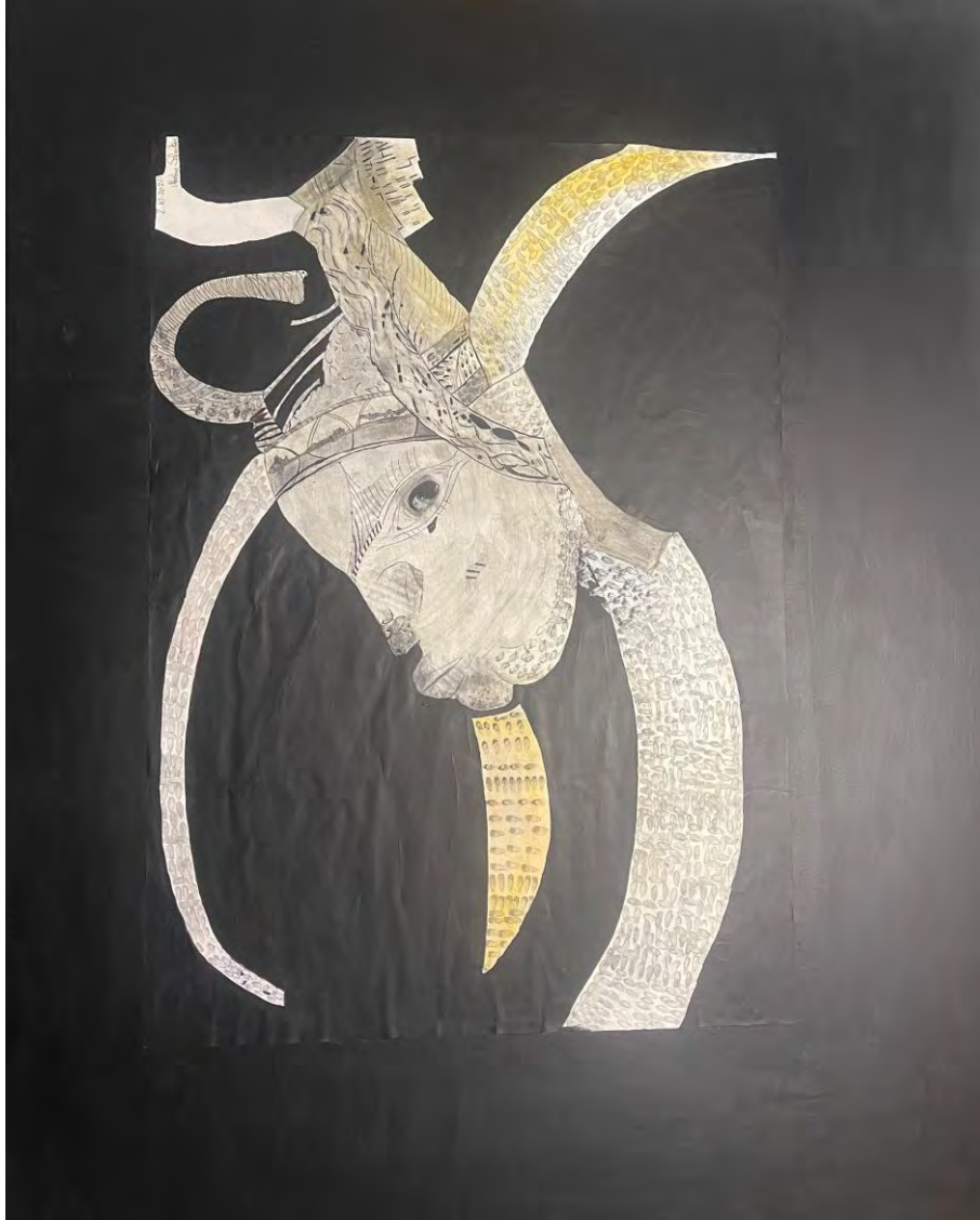
Martina Schenker: Archaic consciousness (Archaisches Bewusstsein) Mixed media drawing, collage, acrylic / 80x100cm, 2020