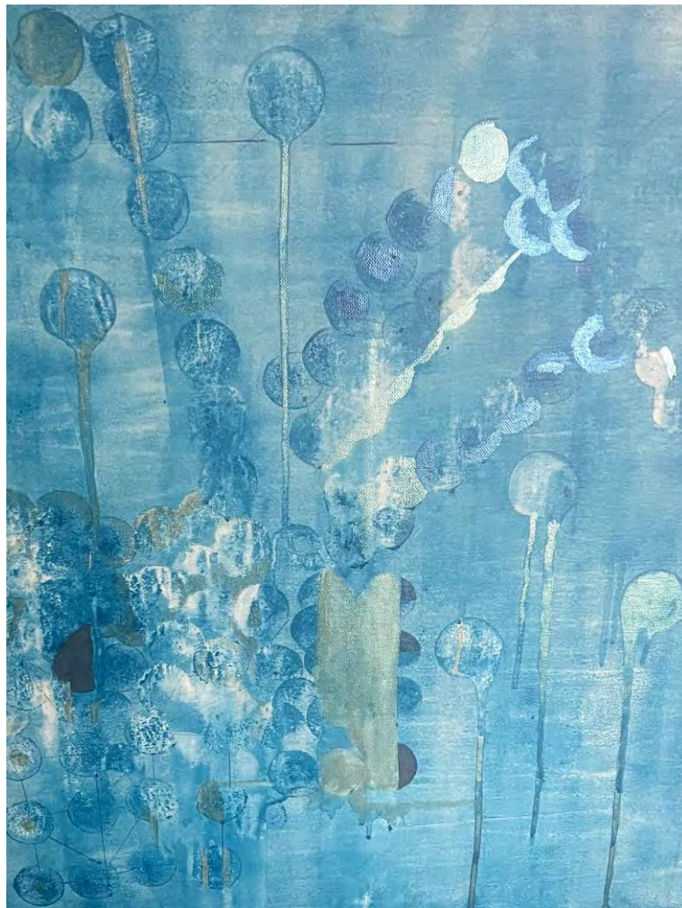
Martina Schenker: Aqua Frequency (Aqua Frequenz / Detail) Mixed media on canvas, 40x40cm, 2025