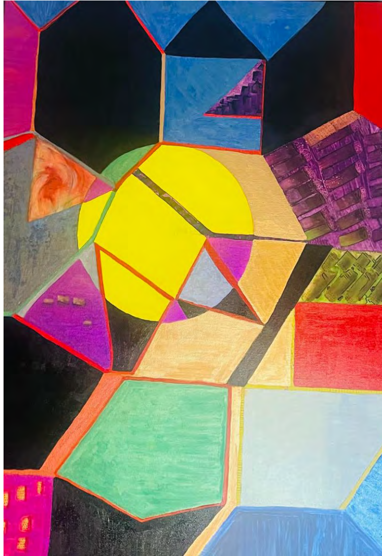
Martina Schenker: Geometry of Inner Light (Geometrie des Inneren Lichts / Detail) Acrylic on canvas, 50x70cm, 2024