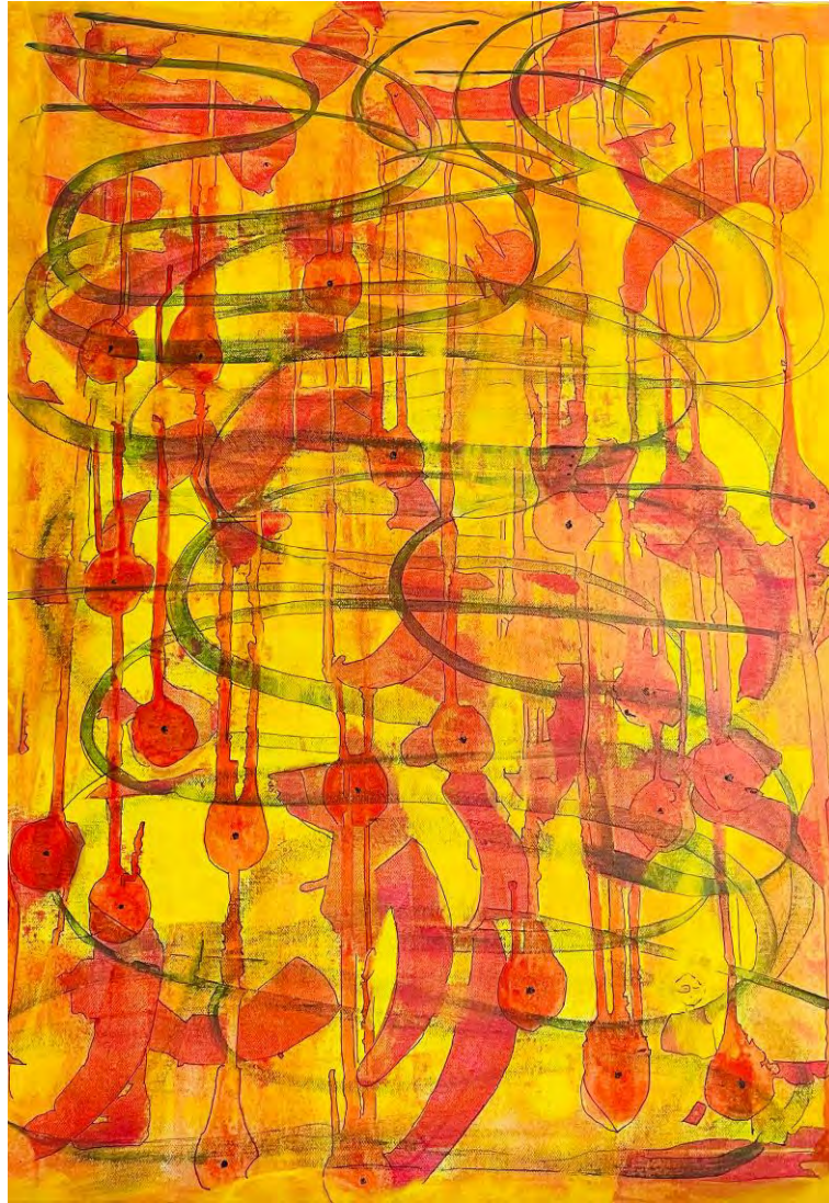
Martina Schenker: Sun flow (Sonnenfluss / Detail) Acrylic, ink and charcoal on canvas, 60x80cm, 2023