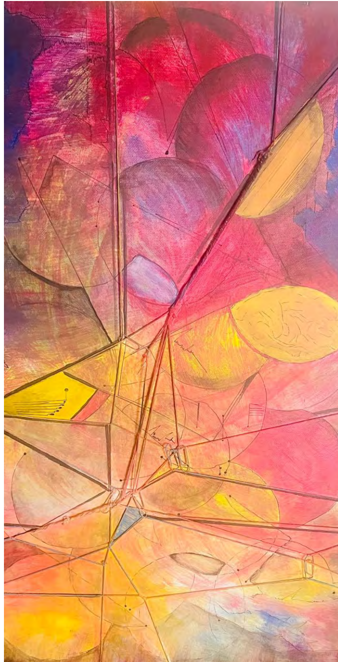
Martina Schenker: Leaves whispering in the cosmos (Blattgeflüster im Kosmos / Detail) Mixed media on canvas, 40x80cm, 2020