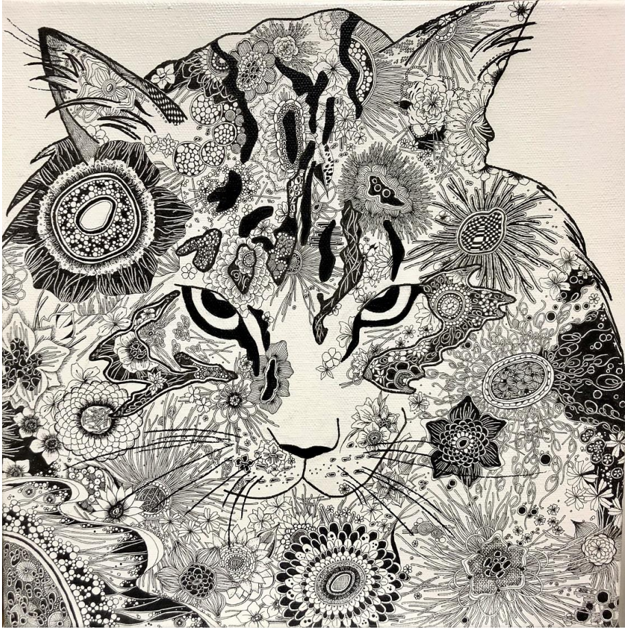
Teruko Kumamoto: I Am the Queen / Ink, acrylic gouache, 30 x 30 cm, 2026