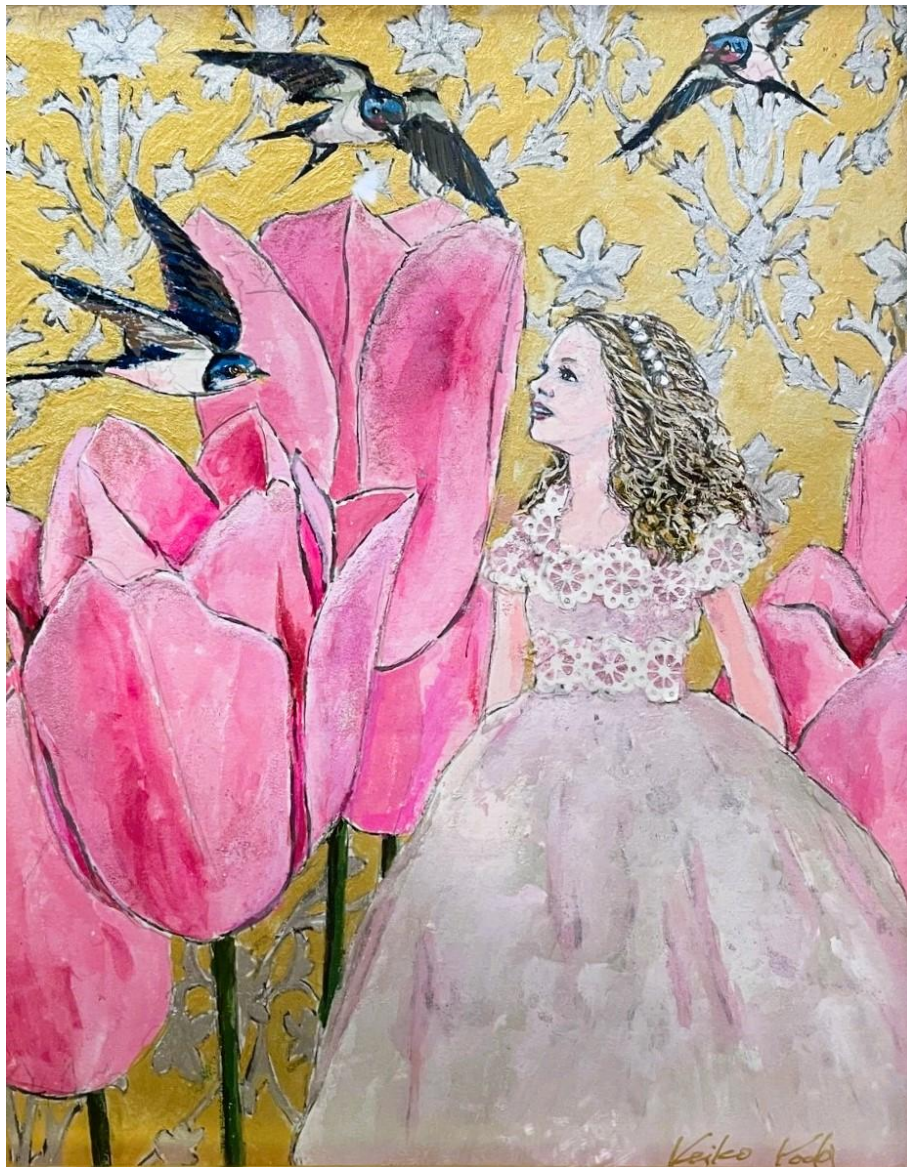
Keiko Yoda: Thumbelina / Watercolour, mineral pigments, ink, paper / 27.3 x 22 cm, 2025