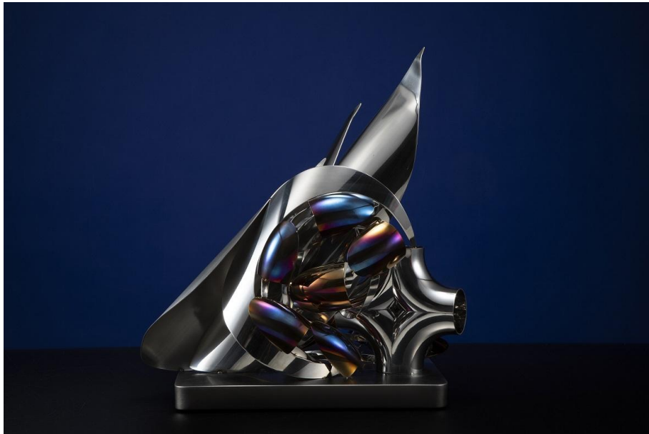
Yuko Akiya: Spring storm II / Stainless, 46 x 43 x 31 cm, 2023