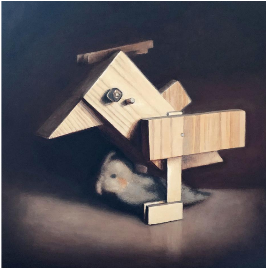
Toru Teranishi: Just the two of us 05 / Acrylic on canvas, 33.3 x 33.3 cm, 2022