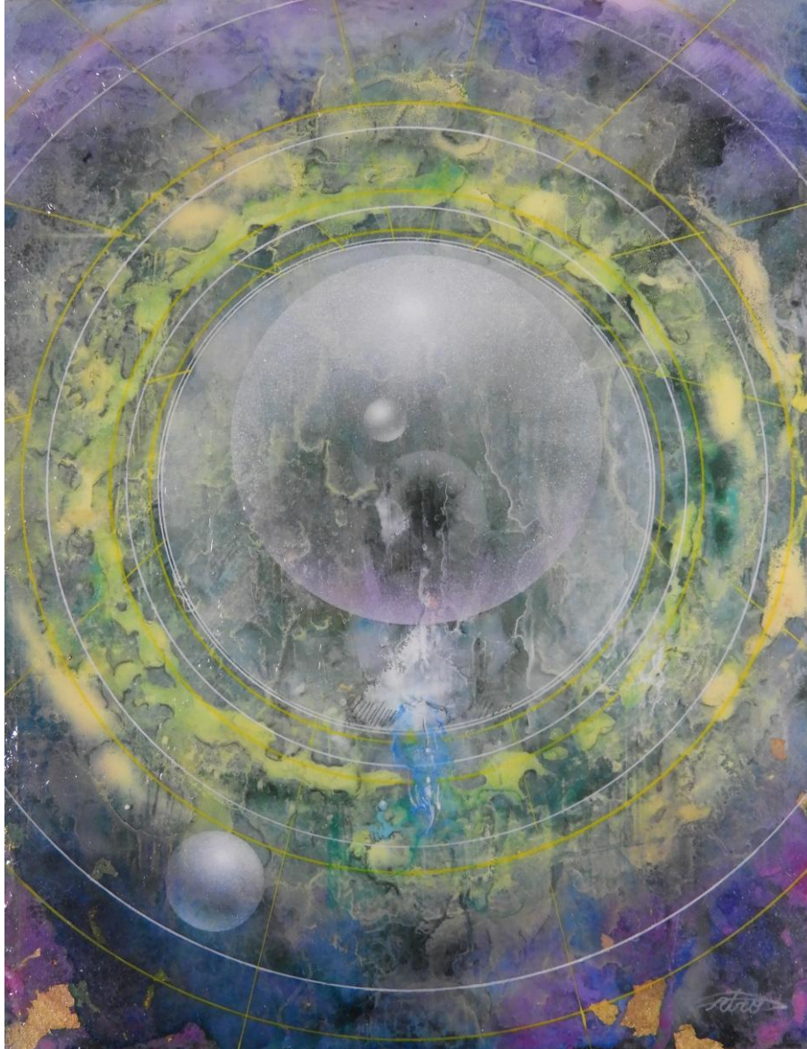
Uro Shinomiya: Patora moon 2549 / Acrylic on canvas, 18 x 14 cm, 2025