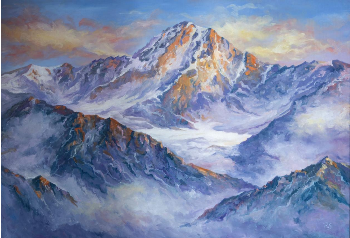
Robert Schwander: Sustenhorn / Oil on canvas, 70x100cm, 2026

The Sustenhorn appears as a powerful form amid fog and vastness. Light and shadow sculpt the mountain in soft colours, creating a serene atmosphere.