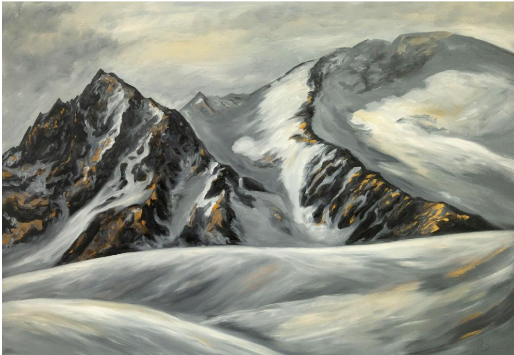
Robert Schwander: Shadow ridge / Oil on canvas, 70x100cm, 2025

A mountain massif of snow and rock interspersed with warm golden tones lends the cool landscape surprising liveliness.