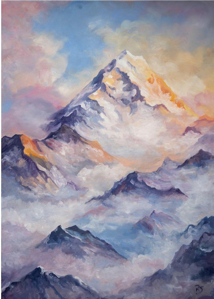
Robert Schwander: Über den Wolken (Above the clouds) / Oil on canvas, 50x70cm, 2025

A moment of silence between heaven and earth. Soft pastel tones, rising mist and a summit that seems to glow in the warm light. This image conveys vastness, tranquillity and the power of nature.