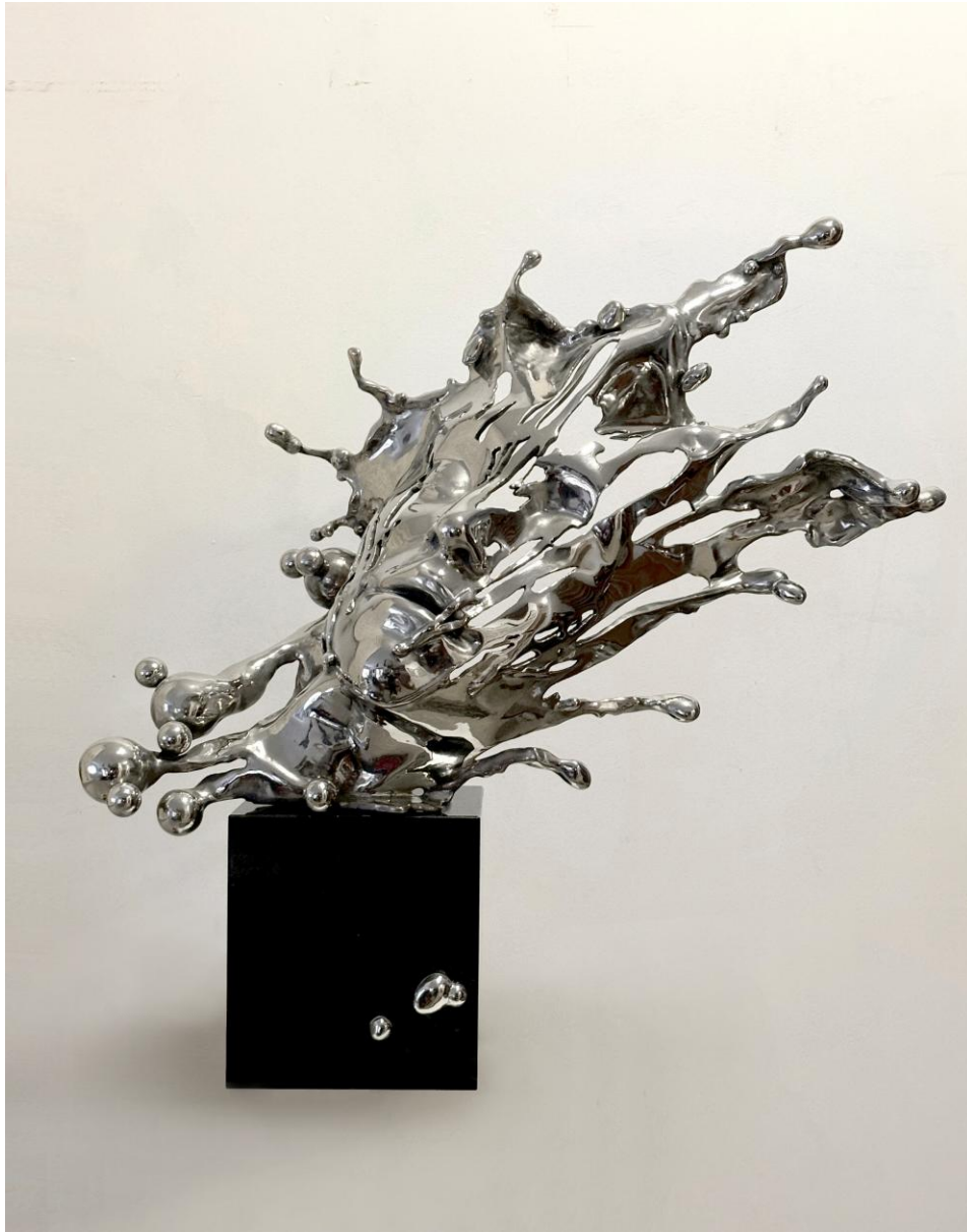
Péter Párkányi Raab: Stilla / Nickel-plated bronze and black granite, 75 x 68 x 30 cm, 2025