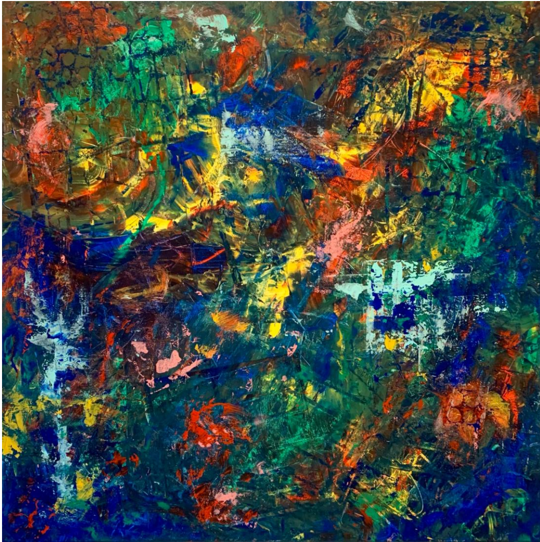
Carolin Schmidt / LaFabricarte: Kompensation (Compensation) / Mixed media on canvas, 100x100cm, 2026