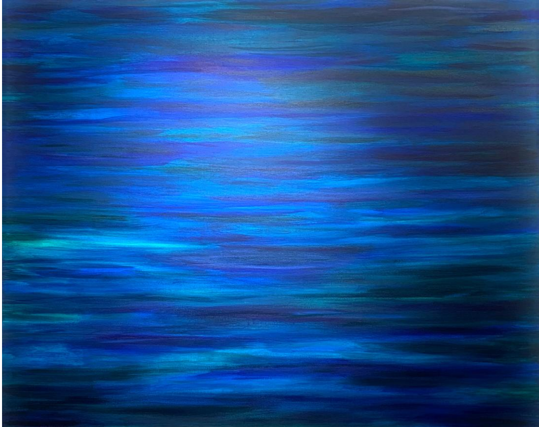
Carolin Schmidt / LaFabricarte: Die Leere (The emptiness) / Acrylic on canvas, 100x120cm, 2025