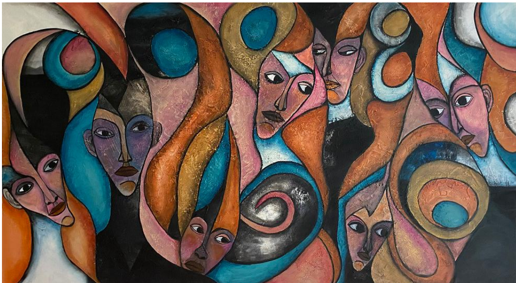
Georgeta Abagiu: Neid (Envy) / Acrylic on canvas, 180x100cm, 2021

Die rumänische Künstlerin Georgeta Abagiu widmet sich in ihrer Arbeit der Malerei als Ausdruck einer tief empfundenen Leidenschaft. Jedes ihrer Gemälde trägt eine klare, thematisch präzise Botschaft in sich und vermittelt Emotionen, die aus persönlichen Erlebnissen und intensiven Momenten entstehen. Ihre Werke sind ein Spiegel subjektiver Wahrnehmung: sensibel, kraftvoll und direkt.