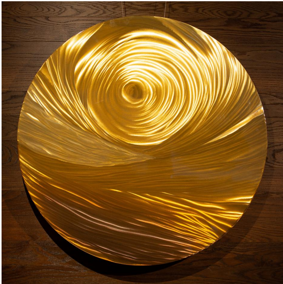
Greta Rohner: Sunrise / Brass plate artfully polished and chemically coloured, Ø 100cm, 2025

Greta Rohner, in Davos geboren, zeigt in ihrer künstlerischen Praxis eine konsequente Weiterentwicklung. Auf der Suche nach neuen, aussergewöhnlichen Ausdrucksformen experimentiert sie mit unterschiedlichen Materialien, insbesondere mit der Metalllegierung Messing. Dabei verbindet sie künstlerische Intuition mit technischem Können sowie einem ausgeprägten Gespür für Form und Struktur.