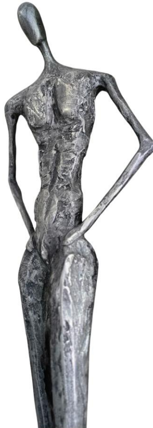
Cedric Steiner: Odin / Microcement, H.180cm, 2024

Cedric Steiner ist ein österreichischer Künstler, der für seine eindrucksvollen Skulpturen und seine Metallkunst bekannt ist. Seine kreativen Arbeiten verbinden technische Raffinesse mit künstlerischer Ausdruckskraft und thematisieren häufig Aspekte der Natur und der menschlichen Erfahrung. Bereits in jungen Jahren begann er, mit verschiedenen Materialien zu experimentieren und Alltagsgegenstände in beeindruckende Kunstwerke zu verwandeln. Neben Bildern und Skulpturen kreiert er auch individuelle ästhetische Erfahrungen, die von Möbeln bis zur Raumgestaltung reichen.