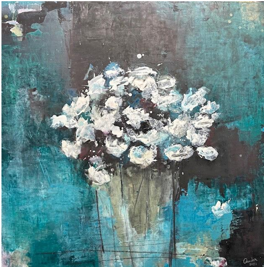
Anita Steiner: With Love / Acrylic mixed media, 120x120cm, 2025

Anita Steiner ist eine österreichische Künstlerin, die in der Ostschweiz lebt und arbeitet. In ihren Werken erzählt sie Geschichten, die Ausdruck ihrer inneren Bilder und Gedanken sind. Diese entstehen durch einen vielschichtigen kreativen Prozess. Sie verwendet Materialien wie Acrylfarbe, Kohle und Pigmente und arbeitet oft mit mehreren Schichten, um Intensität und Spannung zu erzeugen. Es sind emotionale und spannende Kunstwerke, die tief in ihrer persönlichen Erfahrung verwurzelt sind.