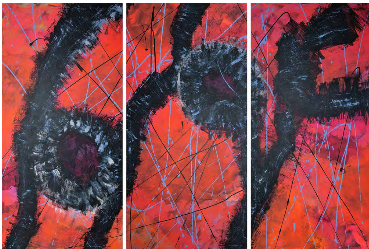
Ulrich Erkelenz: ItSheHe / Serie Bildnisse (Portraits) / Acrylic on canvas