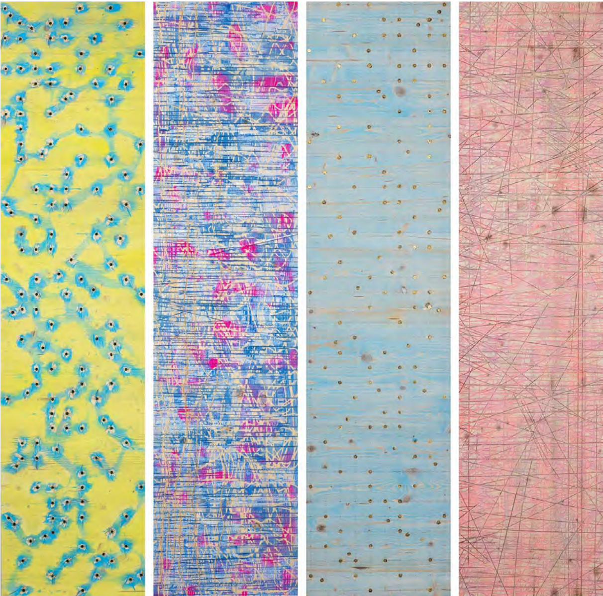
Ulrich Erkelenz: Set 058 / Serie Lignulyphen / Painting on wood