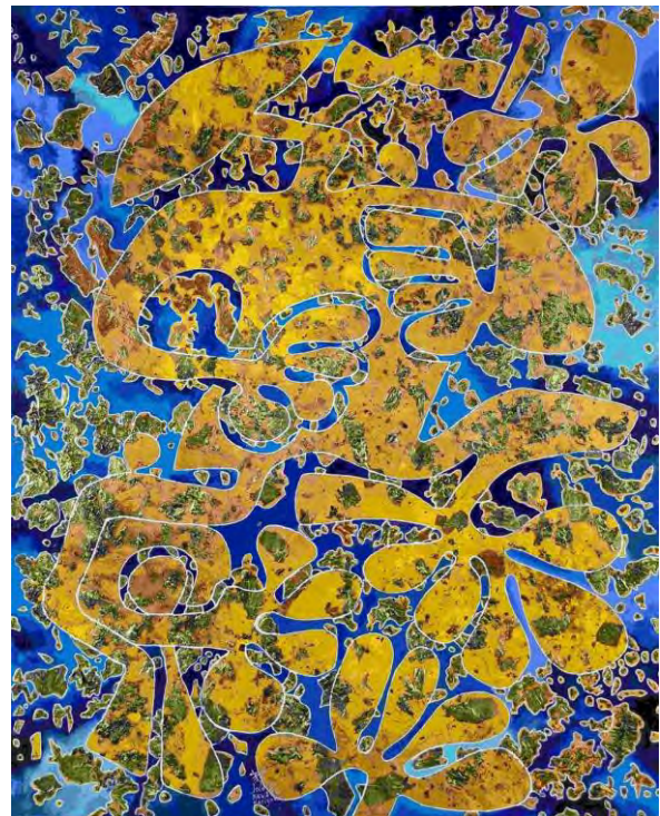
Akwaba Matignon: Puro de Oro (783) / Acrylic, 81x100cm