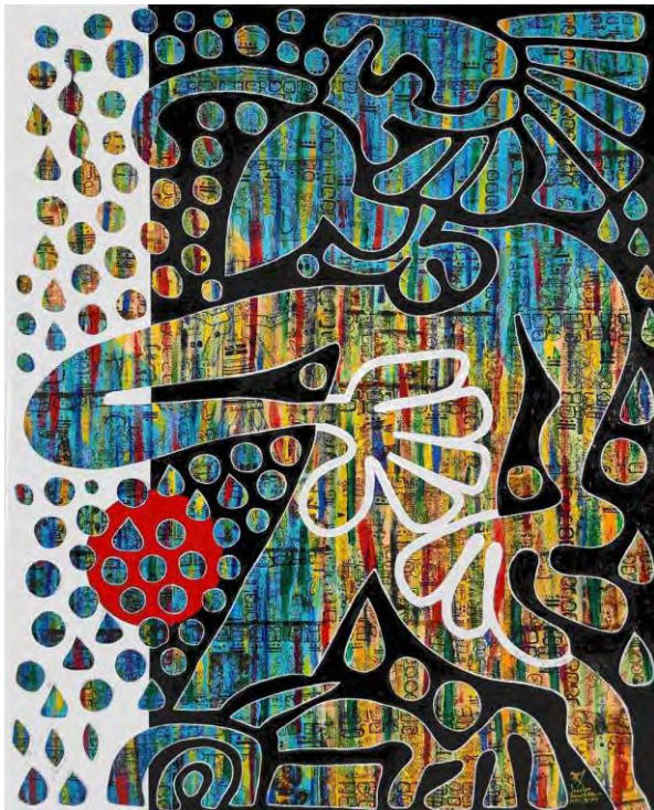
Akwaba Matignon: Pok Ta Pok (776) / Acrylic, 81x100cm

Das Format der Werke, die Komposition, die Wahl der Farben und die Titel sind Teil eines Reflexionsprozesses über das Warum des Malens. Die Figuren in den Werken sind das Ergebnis graphischer Studien. Akwaba Matignons Werk bewegt sich zwischen Gegenständlichkeit und Abstraktion und fängt das "Unsichtbare" ein.