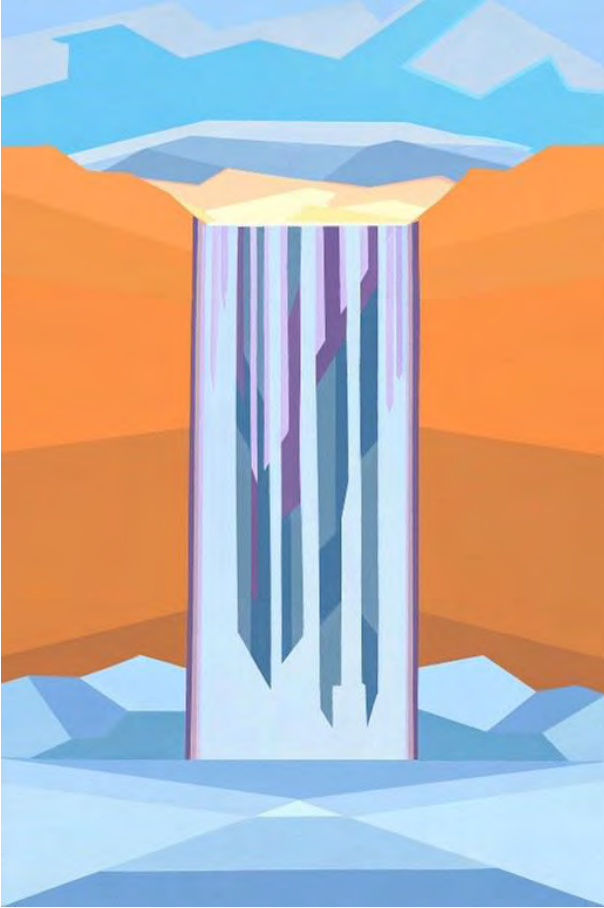
Charlotte Harron: Symmetry in Flow Acrylic on canvas, 91.4 x 61 cm, 2024