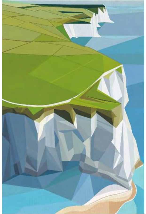
Charlotte Harron: White Cliffs of Summer Acrylic on canvas, 91.4x61cm, 2024