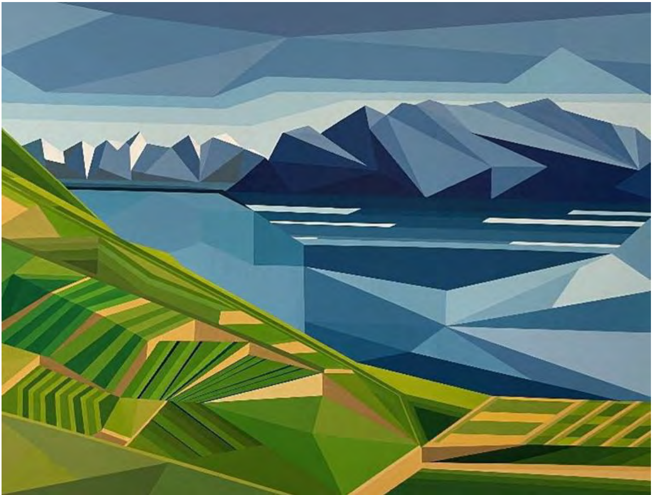
Charlotte Harron: Ode to Vaud / Acrylic on canvas, 76x101.6cm, 2023

Charlotte Harron ist eine neuseeländische Künstlerin, deren Karriere sie von den USA in die Schweiz geführt hat, wo sie derzeit lebt und arbeitet. In ihren Bildern manifestiert sich eine überzeugende Verschmelzung von Farbe, Licht, geometrischen Formen, Abstraktion und Design. Die resultierende Kombination erzeugt visuell fesselnde und zum Nachdenken anregende Werke.