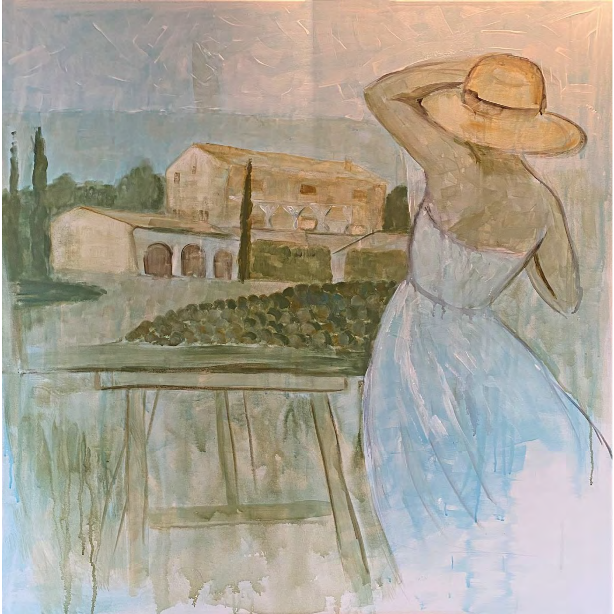
YanYan: Inspiration / Acryl auf Leinwand, 120x120cm, 2022