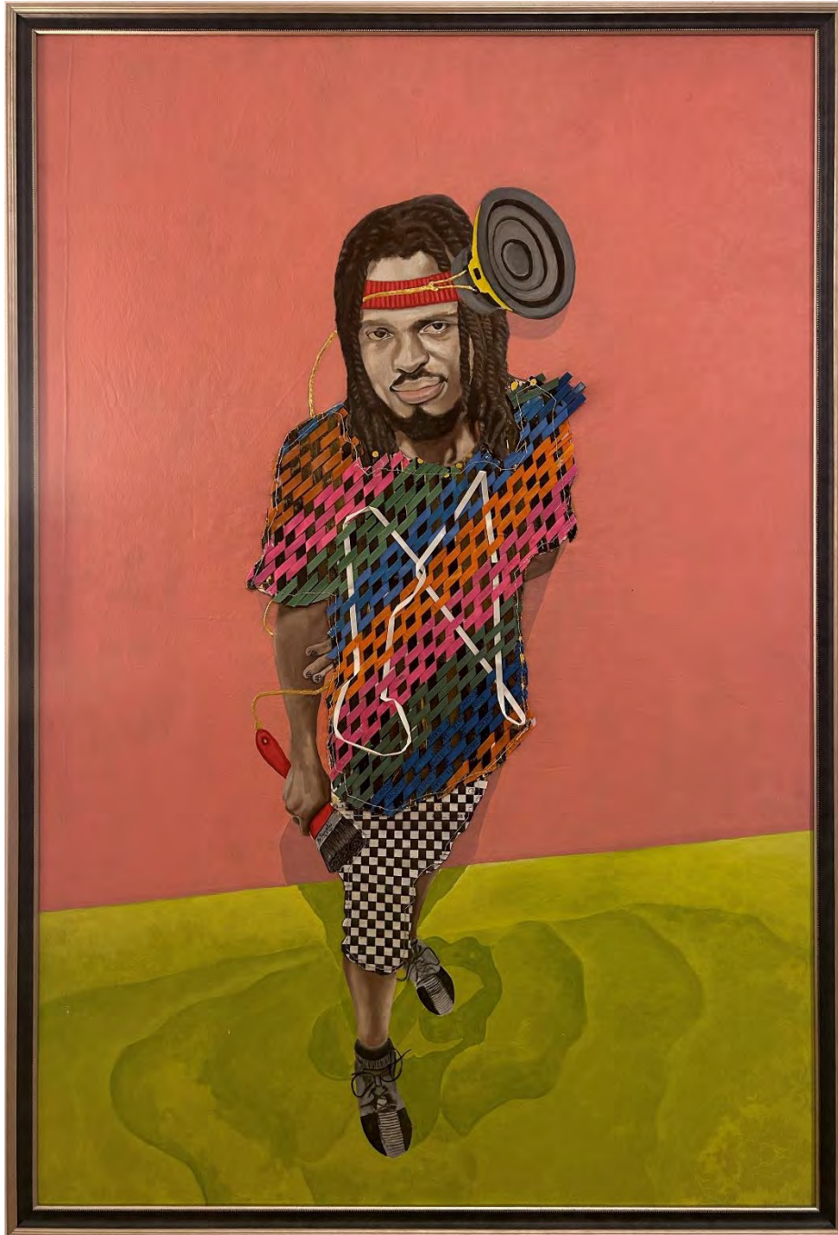
Nii Anyetei Ras: El don de la comunicación (Gift of communication) / Mixed media, 181 x 119 cm, 2022 https://www.youtube.com/watch?v=iptqd-zPmfA

Reku Art Gallery | Calle de Valverde 30, Bajo 2, 28004 Madrid, Spain +34 68 958 71 14 | www.arvivid.com/reku-art