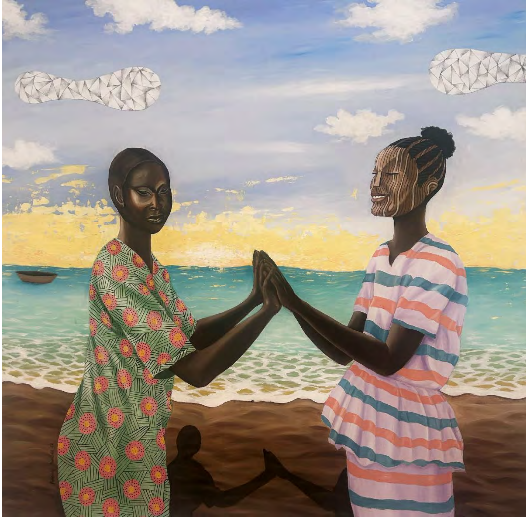
Adeniyi Damilola: Tinko Tinko / Acrylic and graphite paint on canvas, 121 x 121 cm, 2021 https://www.youtube.com/watch?v=nYGG3b99WM8