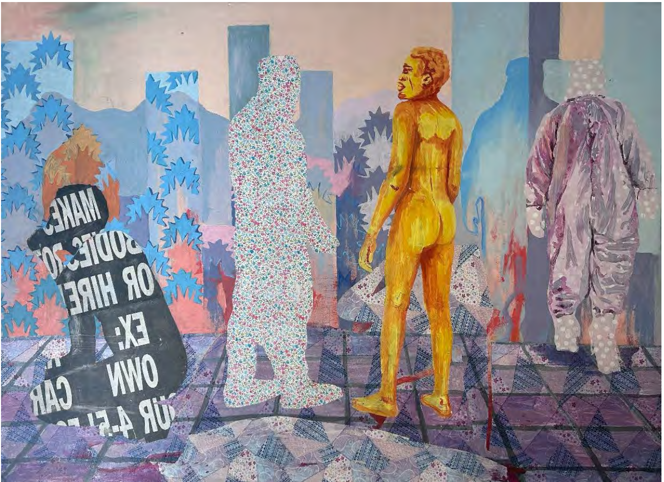
Phumulani Ntuli: Cuerpos de alquiler (Bodies for hire) / Mixed media collage, paper transfer and acrylic on canvas, 178 x 132 cm, 2021 / https://www.youtube.com/watch?v=sF-oYZBSweY

In seinem Werk verschmelzen künstlerische Forschung, Skulptur, Videoinstallation und performative Praktiken. Immer wieder bezieht er unterschiedliche Publikumsgruppen ein und versucht, Lücken, Brüche, Stille, Pausen und Überbleibsel der Geschichte sichtbar zu machen. Ntulis Arbeiten beschäftigen sich mit fiktiven Geografien, Simulationen, Archiven und Repräsentationen. Er untersucht diese Themen durch die Kollision von Dokumentation und Fiktion in Collagen, Performances und Videoinstallationen und hinterfragt das Format objektiver Medien bei der Darstellung historischer Ereignisse und Situationen innerhalb einer geopolitischen Imagination.