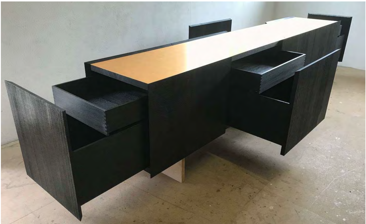
Christian Friedl: Goldschatz / Mooreiche, Edelstahl, Blattgold 23 kt / 310 x 56 x 75 cm / Unikat