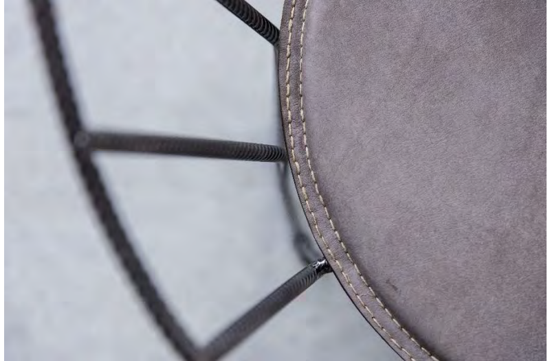
Christian Friedl: Mono Chair / Torstahl, Nubuk-Naturleder, Hanfgarn / Auflage 6 Stück

Mono Chair ist ein unaufdringliches Sitzmöbel mit grosser Präsenz: Das Grundmaterial ist Torstahl, ein Werkstoff, der in den meisten Fällen im wahrsten Sinne des Wortes in Beton gegossen wird.