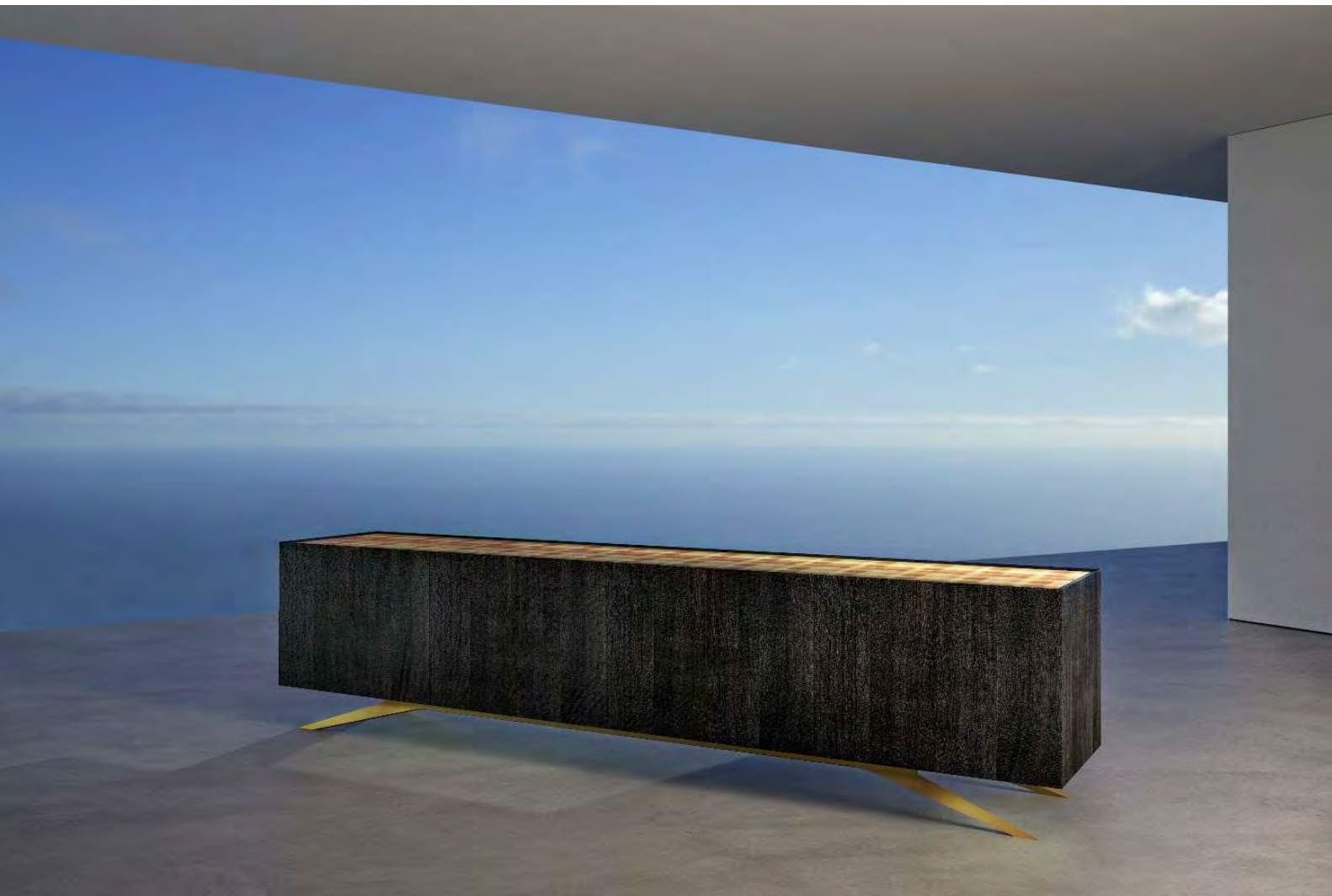
Christian Friedl: Goldschatz / Mooreiche, Edelstahl, Blattgold 23 kt / 310 x 56 x 75 cm / Unikat mit Alterszertifikat der Mooreiche von 5300 Jahren

Christian Friedl, geboren 1970 in Feldbach in der Steiermark, ist gelernter Tischlermeister mit Schwerpunkt Innenarchitektur und Möbeldesign. Friedl erfindet sich 2019 als Holzgestalter neu und gründet seine eigene Manufaktur „unique-soulart-work“.