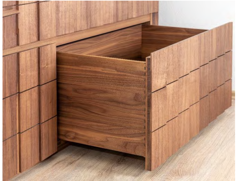
Christian Friedl: Sunrise / Nussbaum massiv, Messing massiv / 150 x 85 x 53 cm / Auflage 2 Stück

Schräg geschnitten, fein gefächert in massivem Nussbaum. Sunrise ist eine Ladenkommode mit Charme und Ausstrahlung. In feinsten Handarbeit schmiegt sich ihr Kleid an drei Seiten an, um auf der Rückseite in eine glatte Fläche zu münden. Der Eindruck eng aneinander gereihter Dominosteine verleiht ihr Struktur.