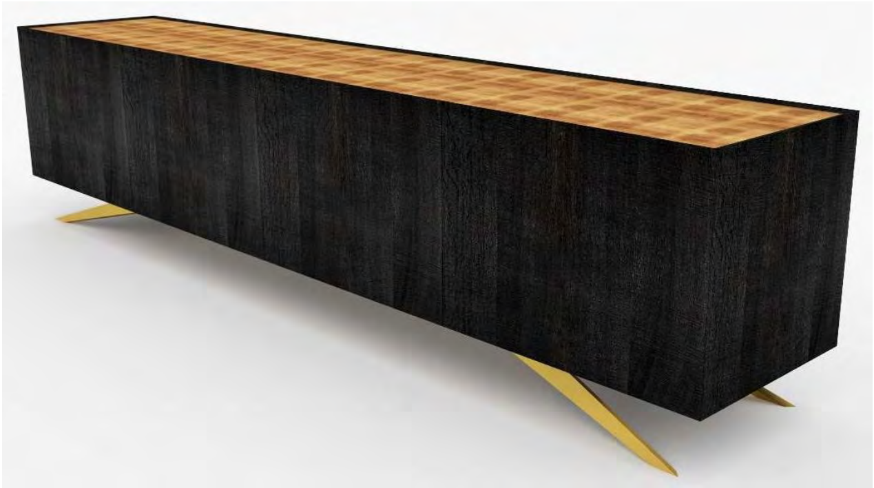
Christian Friedl: Goldschatz / Mooreiche, Edelstahl, Blattgold 23 kt / 310 x 56 x 75 cm / Unikat

Beständigkeit und bleibender Wert gehen eine wunderbare Symbiose ein. Sie haben Christian Friedl dazu inspiriert, etwas zu schaffen, das sich Goldschatz nennen darf. Durch akribische Recherche ist er auf dieses einzigartige Holz gestossen, aus dem in feinsten Handarbeit ein unvergleichliches Möbelstück entstanden ist.