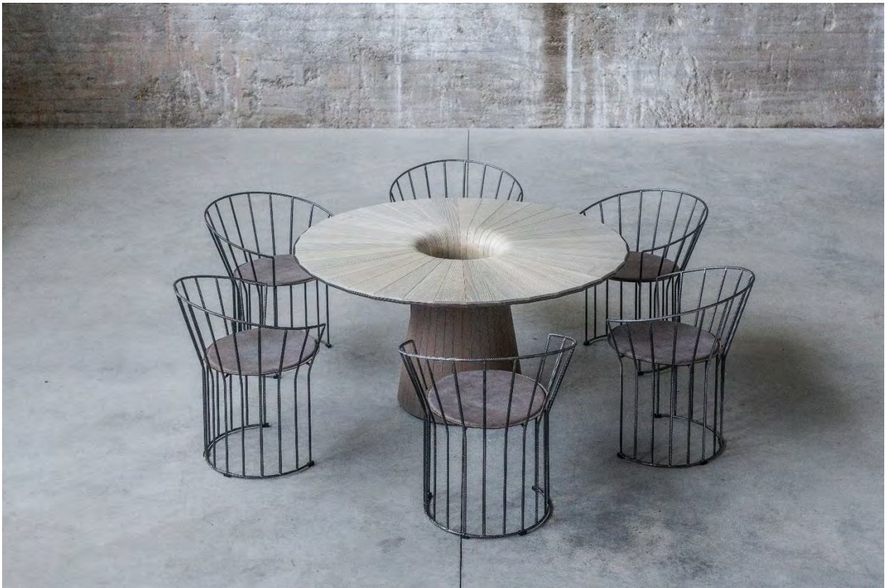
Christian Friedl: Mono Table / Mono Chairs

To assemble the 36 pieces, an elaborate template had to be built and the pieces glued together. Discreet curves at the ends of the slats give Mono Table the appearance of a flower. An anthracite anodised aluminium strip separates the two different woods and closes the circle. Intensive brushing and colouring with natural lye enhances the natural character of the wood and gives the object a fine and soft feel. The result is Mono, a unique piece that will last for generations.