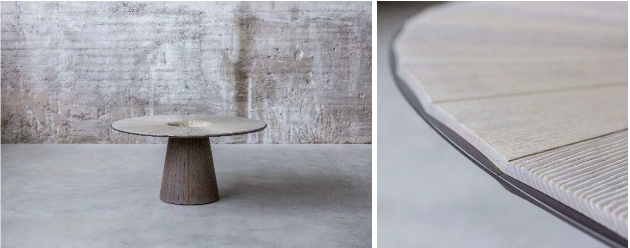
Christian Friedl: Mono Table / Massivholz: Eiche, Esche / Ø 150 cm, Höhe 74 cm / Unikat

Einen Tisch aus massivem heimischen Holz zu bauen, ohne separate Beine, das war die Vision von Christian Friedl. Es ist eine wunderbare Geschichte, in der sich Natur und kreativer Geist vereinen. Das Biegen von Holz ist eine alte Handwerkskunst, die nur noch wenige beherrschen. Und nur wenige heimische Hölzer besitzen die Eigenschaft, sich unter bestimmten Bedingungen biegen zu lassen. Lohnt sich der enorme Zeitaufwand für ein Unikat? Für Christian Friedl ein klares Ja, wenn es darum geht, ein aussergewöhnliches Unikat für einen Liebhaber und Sammler zu schaffen.