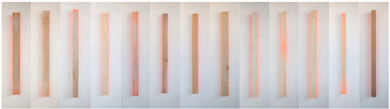
Oto Rimele: Berlin Portraits / Wood, paint, wax. Graphite / composition of 13 portraits / 2018