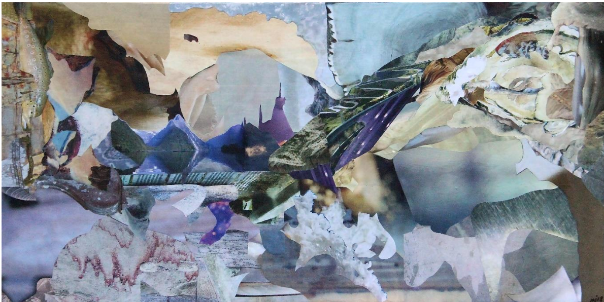
Juliette Agabra: Inlandsis, Collage sur bois, 30x60 cm, 2018