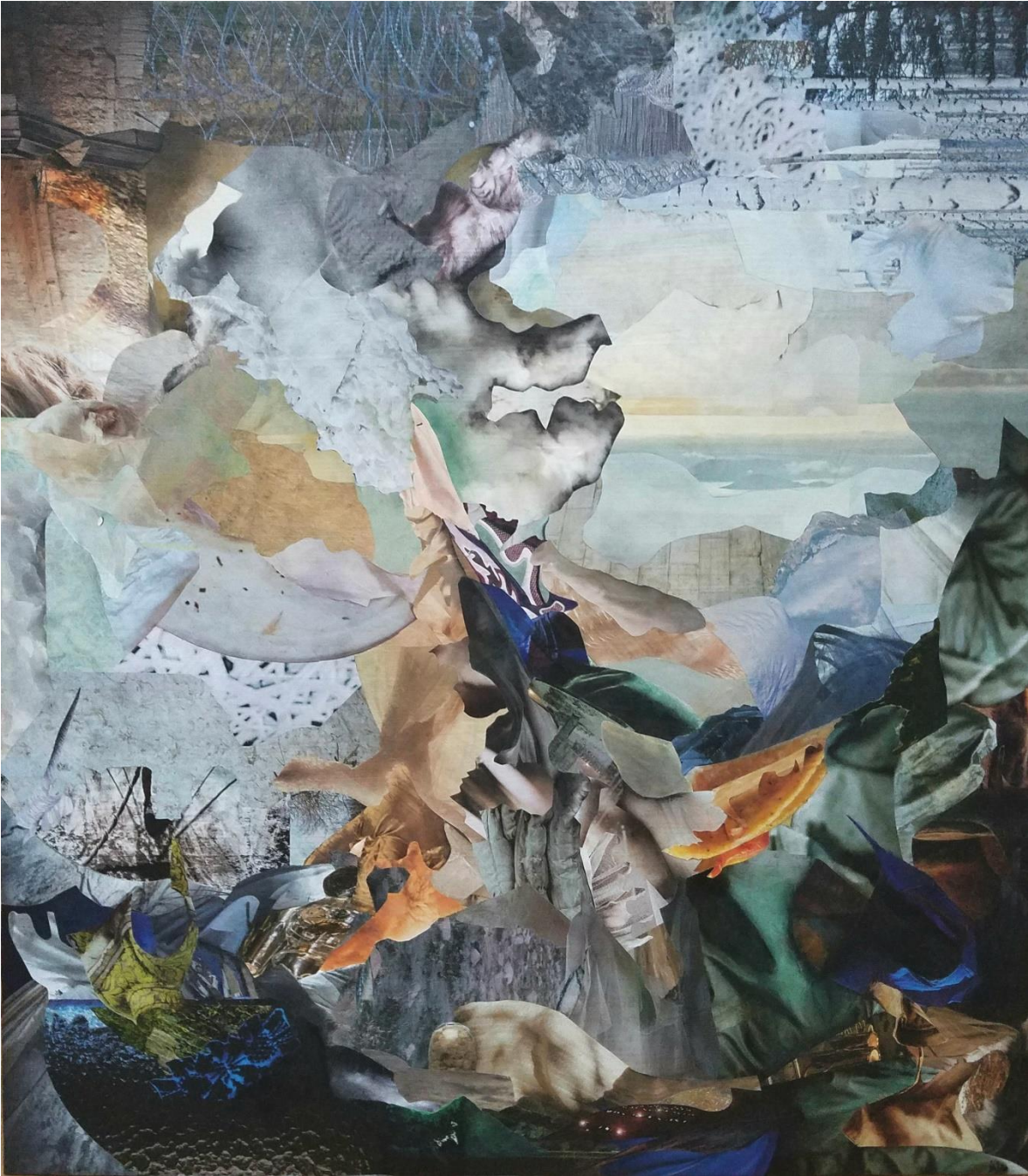
Juliette Agabra: Conquête, Collage sur bois, 60x70 cm, 2020