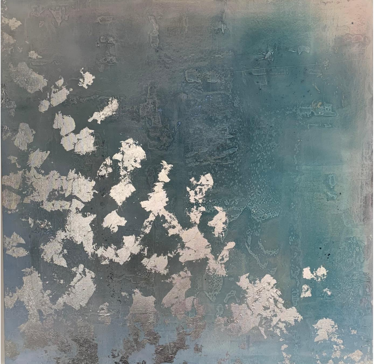
Monika Meier-Roth: dynamisch / Mixed media: Strukturpaste, Acryl, Schlagmetall / 120 x 120 x 4 cm, 2022

«Dieses abstrakte Werk entstand 2022 in einem langen Arbeitsprozess mit Spachtel, Schüttungen und Schlagmetall. Mich viele Stunden auf ein Werk einlassen, es langsam entstehen zu lassen, Schicht für Schicht, das ist für mich Leidenschaft und künstlerische Befriedigung pur.» Monika Meier-Roth