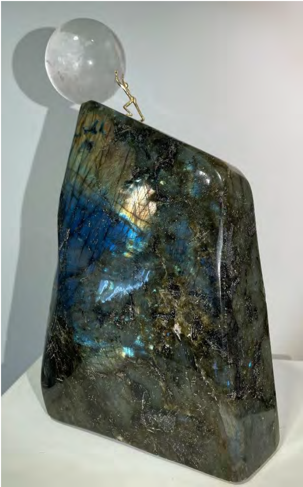
Abb. links: Urs Bischof: Loslassen / Figur 750, Gelbgold mit Bergkristall-Kugel auf Labradorit, 2022