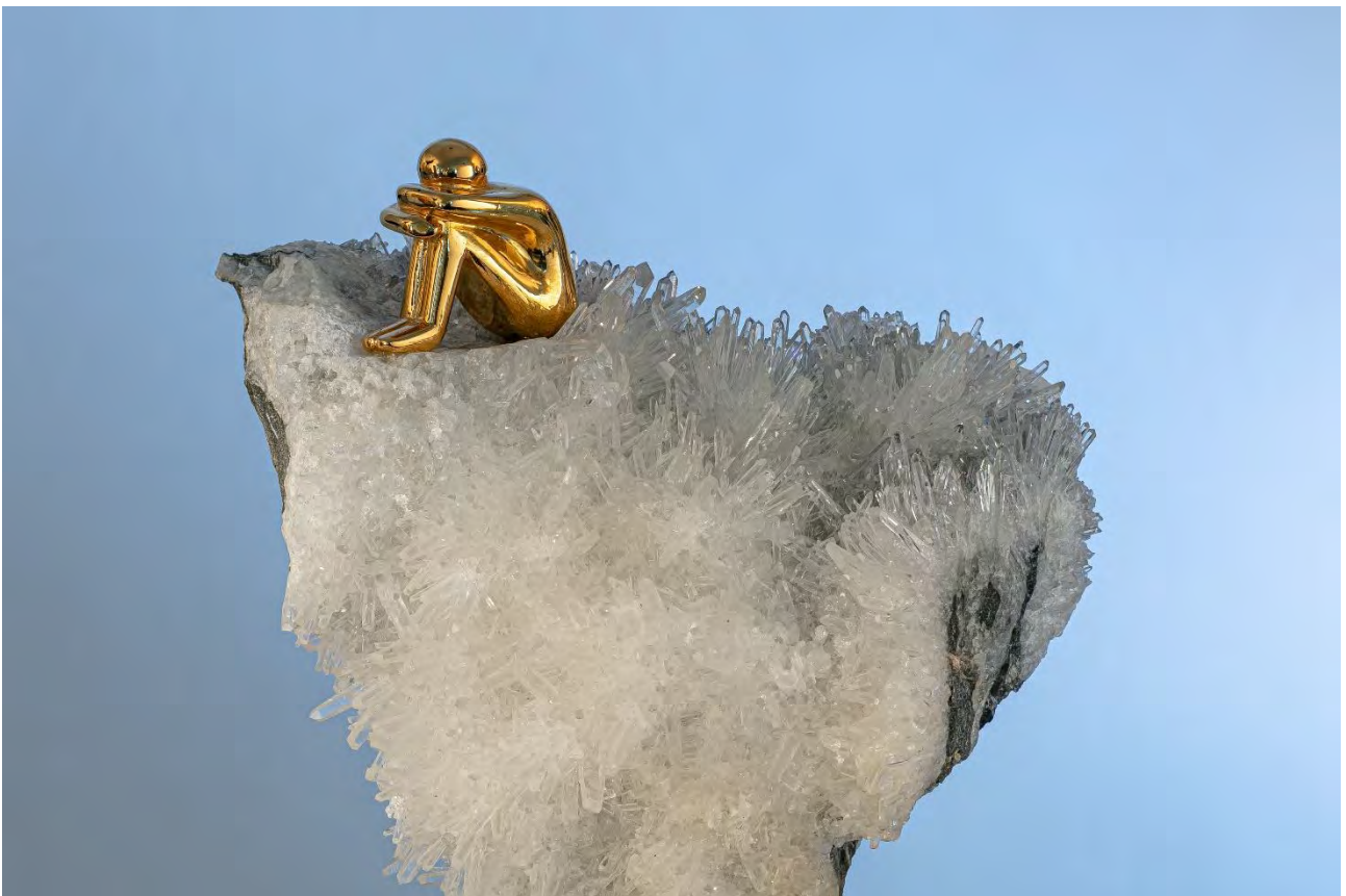
Urs Bischof: Ruhe geniessen / Figur Bronze, vergoldet auf Bergkristall (Tessin, CH), 2021

Urs Bischof versteht es meisterhaft, seine phantasievollen Visionen in Schmuck und Skulpturen zu integrieren. Er will den Betrachter dazu anregen, über sich und seine Umwelt nachzudenken und sich darin wiederzufinden.