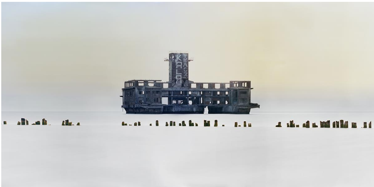
Hassan J. Richter: Amphibie / Fotografie, 120 x 60 cm, 2019

The photos are taken with an analogue medium format camera or a plate camera (4x5 inch). With analogue photography I can make high-quality prints, but above all it requires a special approach. Each photo requires me to take time and calm, and thus to get involved with the places to choose motifs corresponding to the respective lighting conditions. The basis for the intense colours of the pictures is a negative film (Kodak Ektar).