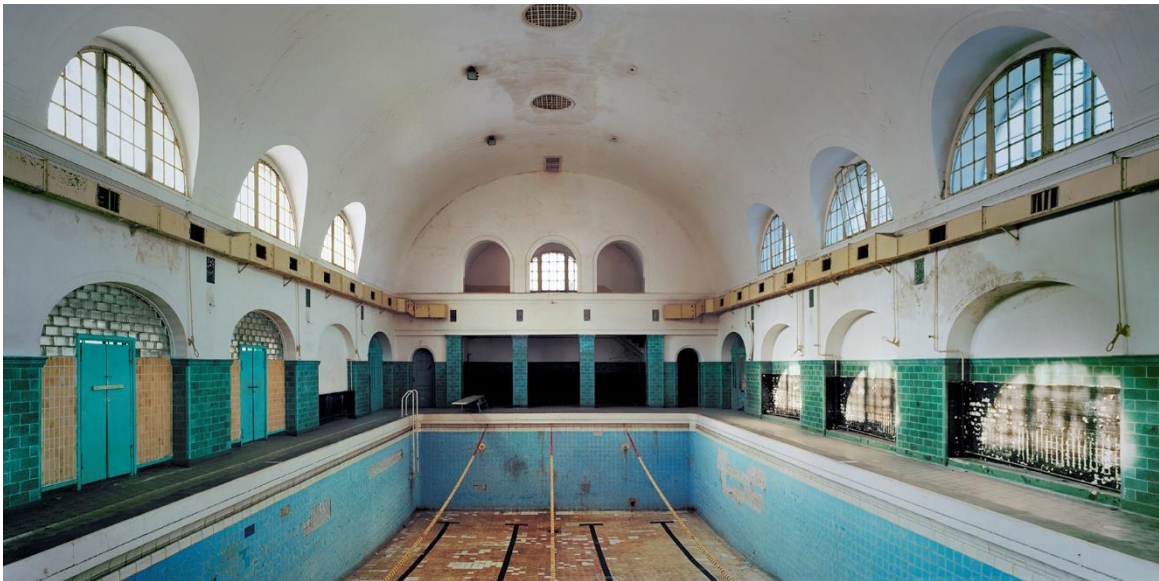
Hassan J. Richter: NichtschwimmerInnenbecken III / Fotografie, LED hinterleuchtet / 120 x 60 cm / 2019

Die Fotos entstehen mit einer analogen Mittelformatkamera oder einer Plattenkamera (4x5 inch). Durch die analoge Fotografie kann ich zum einen hochwertige Abzüge erstellen, vor allem aber erfordert es zum anderen eine besondere Herangehensweise. Jedes Foto verlangt von mir Zeit und Ruhe und damit das Einlassen auf die Orte für die den jeweiligen Lichtverhältnissen entsprechende Motivauswahl. Die Grundlage für die intensiven Farben der Bilder ist ein Negativfilm (Kodak Ektar).