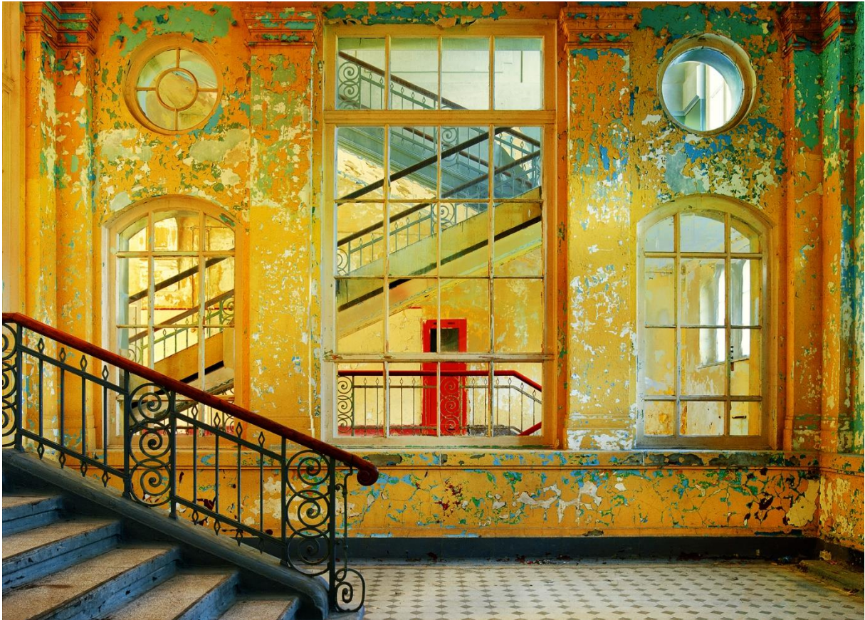
Hassan J. Richter: Die rote Tür / Fine Art Print hinter Acrylglas auf Alu Dibond, 115 x 160 cm, 2010