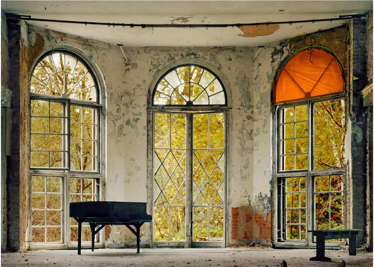
Hassan J. Richter: Konzertpause II / Fine Art Print, 160 x 120 cm, 2010